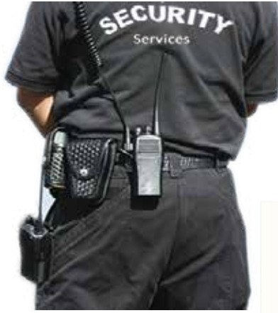
الأجهزة الوقائية المرافقة للدوريات Protective devices accompanying the patrols