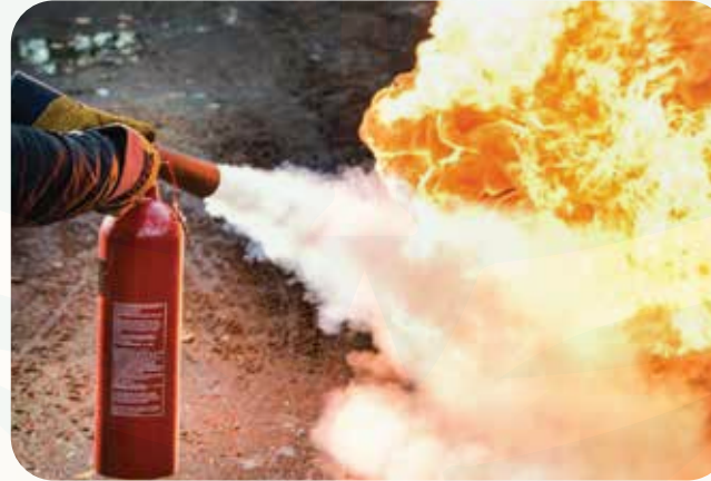
تستخدم في إطفاء معظم أنواع الحرائق في بدايتها و لها فعالية قوية في إطفاء حرائق التجهيزات الكهربائية

They are used in fires of inflammable fluids & quick inflammation, such as dye paints – greases – petroleum liquids.