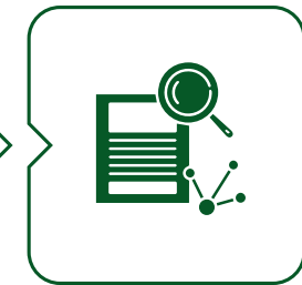
البحث و التطوير Research & Development