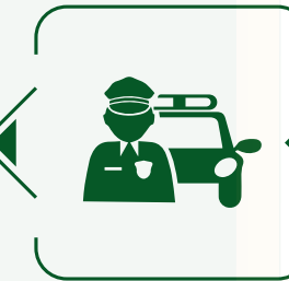
الدوريات و إدارة الحركة Patrols & movement management