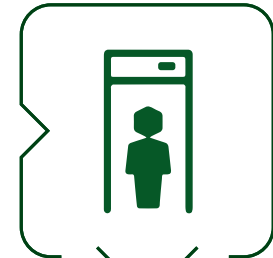
أمن المرافق Facilities security