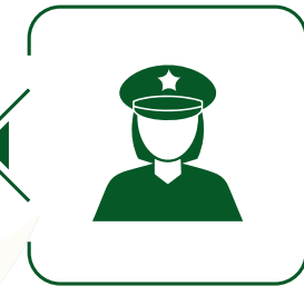
الأمن النسائي Women Security