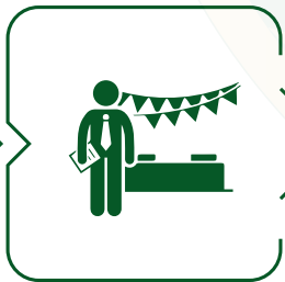
إدارة المهرجانات و الافتتاحات Management of festivals & openings