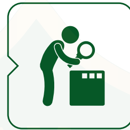
التفتيش و التعقيب Inspection & feedback.