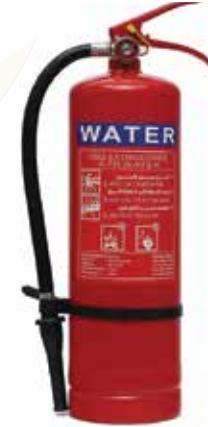
تستخدم لإخماد الحرائق في المواد الصلبة مثل الورق و الخشب و القماش

They are used to extinguish most types of fires from their beginning & they are very effective in extinguishing electrical equipment fires