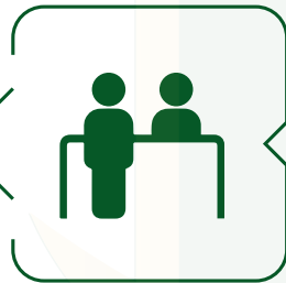
خدمة العملاء والمكاتب الأمامية Client service & front offices