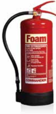
تستخدم في حرائق السوائل القابلة للاشتعال و الالتهاب السريع مثل دهان الاصباغ الشحوم - السوائل البترولية

They are used in fires of inflammable fluids & quick inflammation, such as dye paints – greases – petroleum liquids.