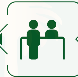
خدمة العملاء والمكاتب الأمامية Client service & front offices